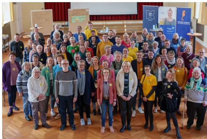
2. platt drift barcamp