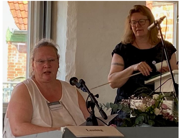
Autorentag in Mölln, eine langjährig durchgeführte Kooperationsveranstaltung des ZfN Holstein mit der Stiftung Herzogtum Lauenburg