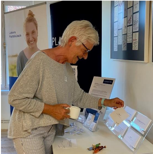
Interessierte bei der Kulturkonferenz des Kreises Schleswig-Flensburg in Unewatt