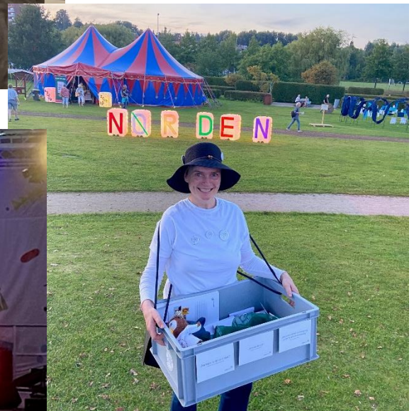
In diesem Jahr gab es einen plattdeutschen Abend auf dem NØRDEN-Festival in Schleswig. Der NDR bot auf der Hauptbühne ein plattpralles Programm mit namhaften Künstlern. Bei der Werbung für diesen Act haben wir gerne unterstützt, statt eigenem „Hüttenwochenende“, wie im vorherigen Jahr, uns jedoch für die Bauchladenvariante an diesem Tag entschieden.